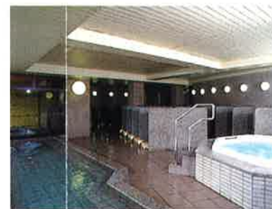
女性大浴場「花水木」