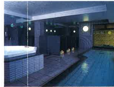
男性大浴場「水芭蕉」