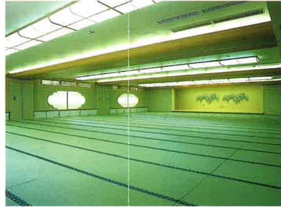
大宴会場「菖蒲の間」